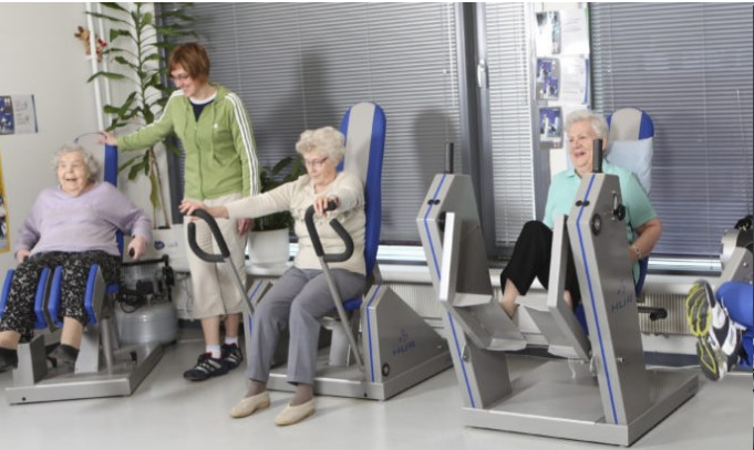
Intensiv träning på gym