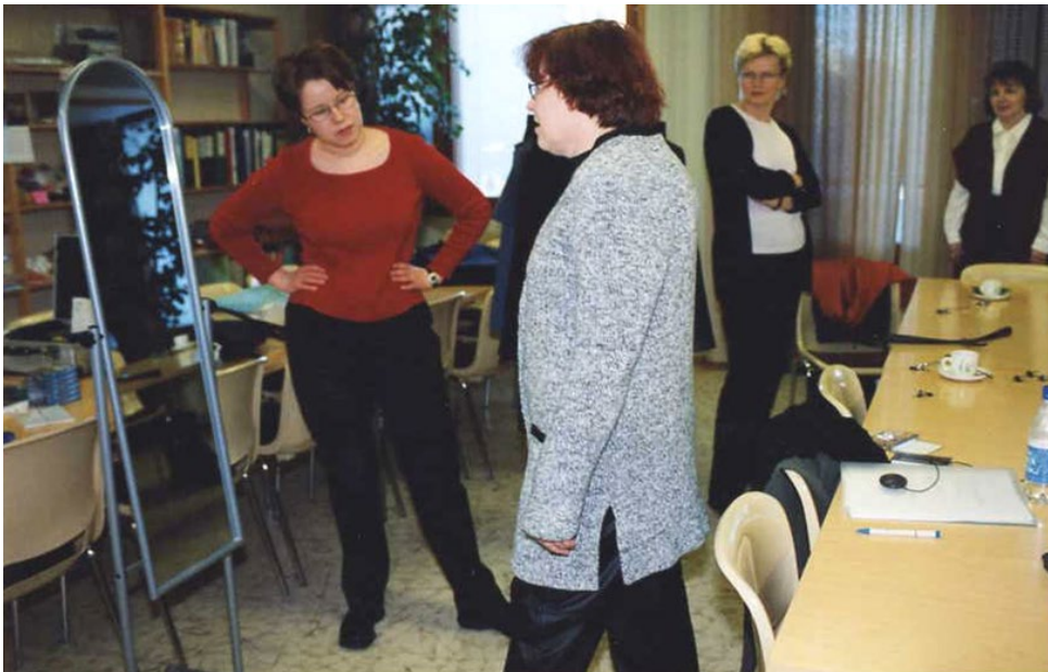
Kuva 1. Haastattelutilanne (tutkija vasemmalla).